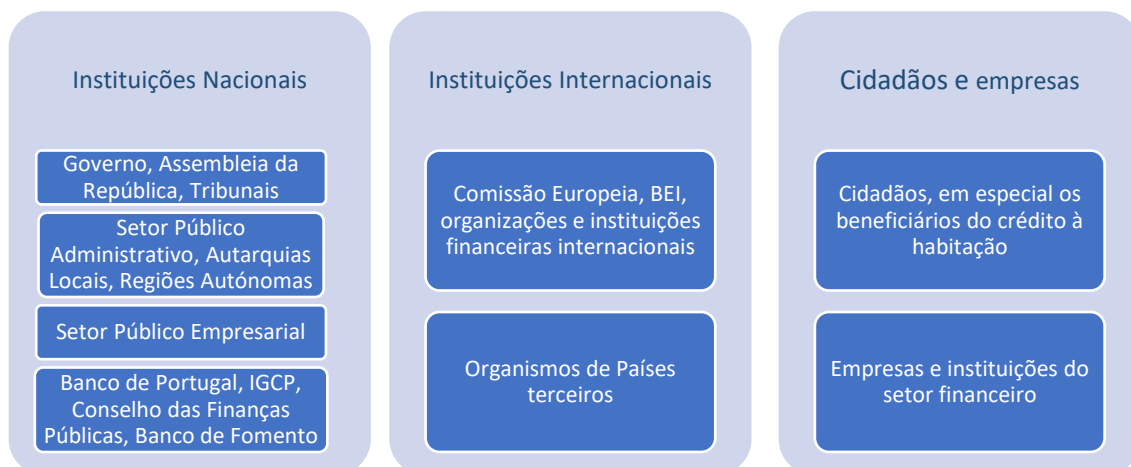
Figura 2 – Principais destinatários

Os serviços da ETF dirigem-se a um amplo conjunto de destinatários, realçando-se o Governo, em especial os membros do Governo responsáveis pela área das Finanças, e as empresas públicas. Os principais destinatários podem ser agrupados da seguinte forma: